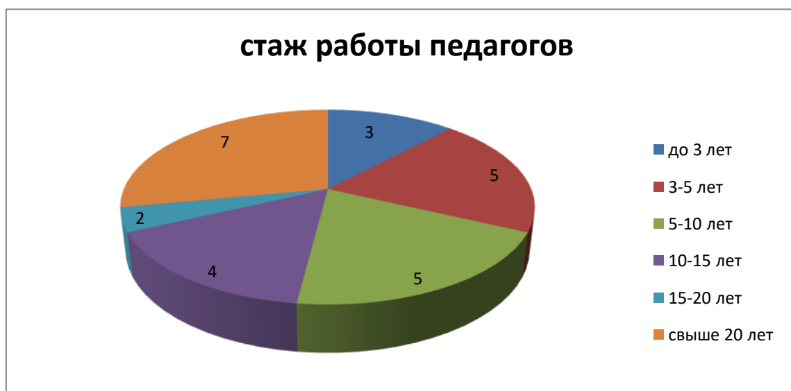
Диаграмма с характеристиками кадрового состава детского сада

Курсы повышения квалификации в 2021-2022 учебном году прошли 5 работников детского сада, из них 5 педагогов. На 31.12.2022 г. 1 педагог проходит обучение в ВУЗе по педагогической специальности. В 2021-2022 году прошли профессиональную переподготовку по должности «Воспитатель ДОО» 5 педагогов.